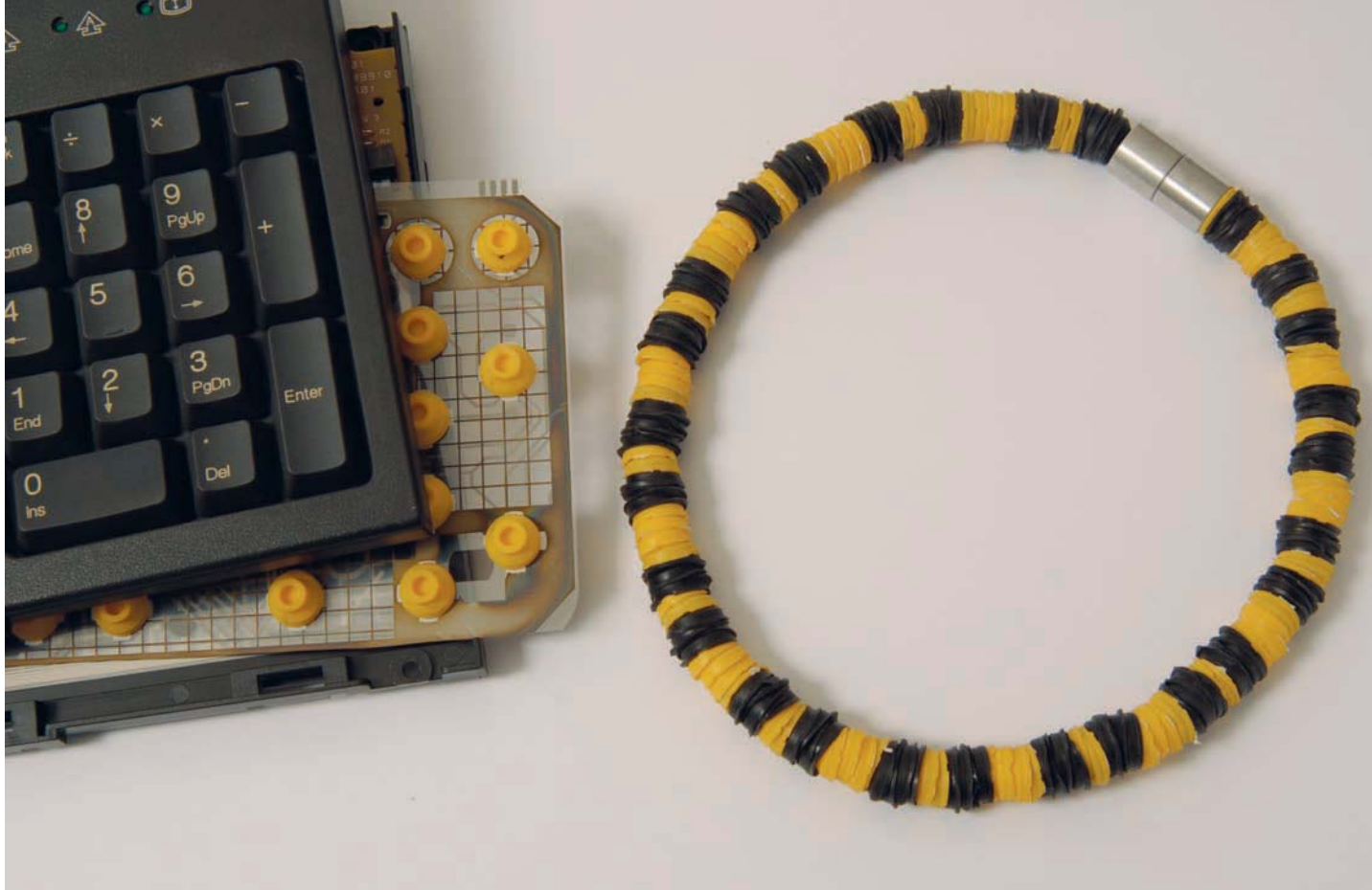
Ausgangsmaterial und Endprodukt: Aus dem Noppenbett einer Tastatur wird die Noppenkette hergestellt. Herstellungzeit: 3 Stunden; Material: Gumminoppen, Drahtlitze, Alu-Verschlüsse, Magnete; Kosten: CHF 40.–

der Recycling-Werkstatt auf, um gegen Voranmeldung all jene Elektro- und Elektronikgeräte einzusammeln, die bei ihren Besitzern nicht mehr benötigt werden. Die Palette des eingesammelten Materials ist breit und reicht von alten Computern und Druckern über defekte Lampen und Staubsauger bis hin zu ausranzierten Kühlschränken.