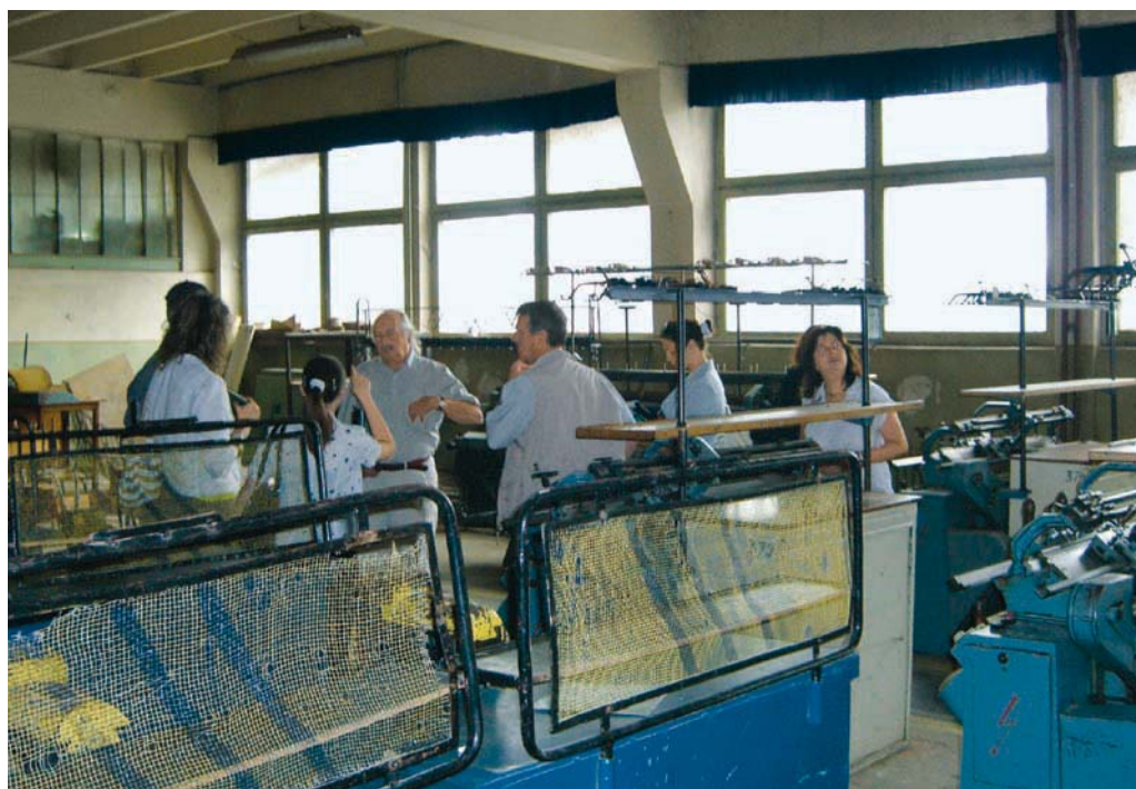
In dieser ehemaligen Lehrlingswerkstatt in Brasov wird schon bald die erste Recycling-Werkstatt der FPSC ihre Tore öffnen.

Alle Beteiligten fiebern nun der Eröffnung der Werkstatt in Brasov entgegen. Wann diese genau stattfinden wird, ist noch nicht klar. Präzise Voraussagen in Bezug auf Termine und Fristen zu machen, erwies sich in der Vergangenheit als schwierig. Es ist aber damit zu rechnen das Ende 2008 oder zu Beginn des nächsten Jahres die Werkstatt ihre Tore öffnen kann.