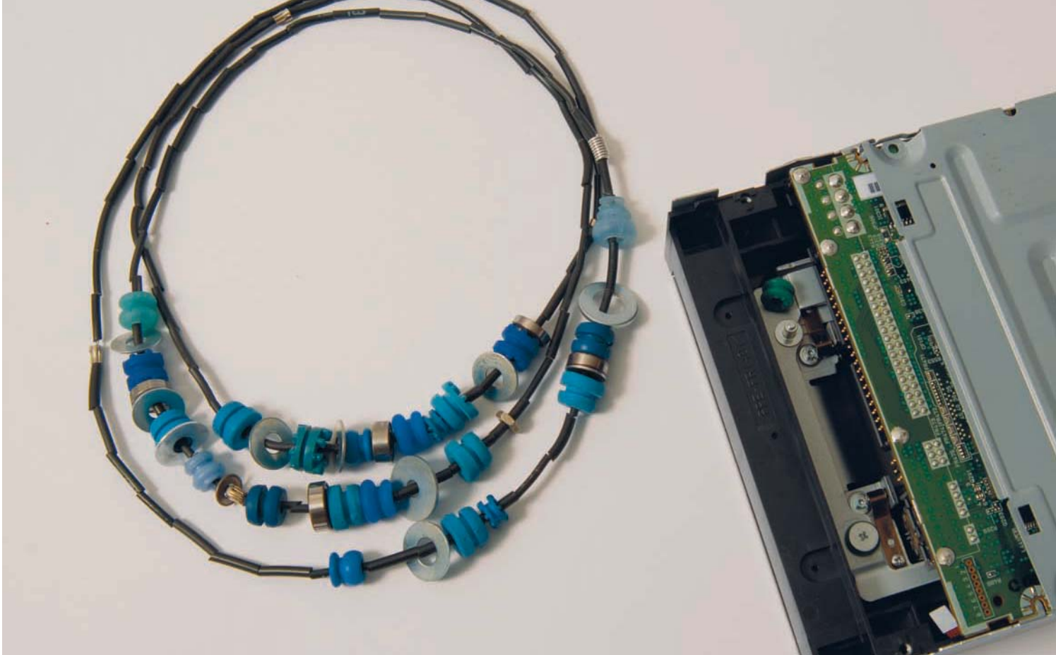
Ausgangsmaterial und Endprodukt: Aus Teilen eines Hard Disk-Laufwerks wird die Pufferkette endless hergestellt. Herstellungszeit: 3 Stunden; Material: verschiedene Puffer aus Laufwerk, Kabel, Drahtlitze, Quetschperlen; Kosten: CHF 30.–

chen Gründen nötig: Zum einen gibt es Material, welches zunehmend rarer wird und schwieriger erhältlich ist. Leiterplatten etwa, aus denen die beliebten Agenden gefertigt werden, werden zum Beispiel aus Datenschutzgründen heute weniger abgegeben als früher. Zum anderen muss das Team aber auch auf Entwicklungen in der Mode Rücksicht nehmen, etwa bei der Produktion von Halsketten: Bis vor kurzem wurden diese